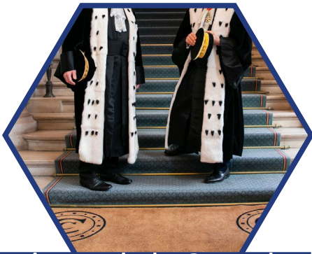
Magistrat de la Cour des comptes