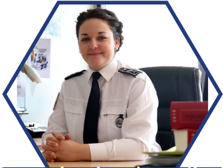
Commissaire de police