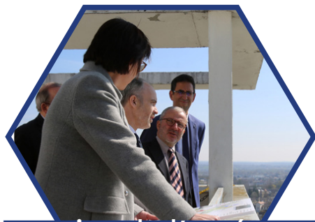
Directrice de l'aménagement urbain et de l'environnement d'une commune de + de 80 000 habitants