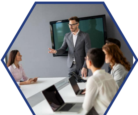
Directeur des ressources humaines d'une commune de + de 40 000 habitants