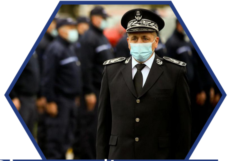
Directeur d'un centre pénitentiaire