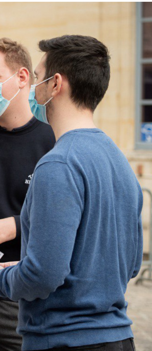
Amélie de Montchalin Ministre de la transformation et de la fonction publiques

La crise sanitaire éprouve durement notre jeunesse. Elle a interrompu ces derniers mois pour beaucoup d'entre eux des projets, remis en cause des ambitions. Mais, au-delà, elle est le révélateur d'un malaise beaucoup plus profond, qui s'aggrave : une partie d'entre elle ne croit plus en ses chances au sein de la République.